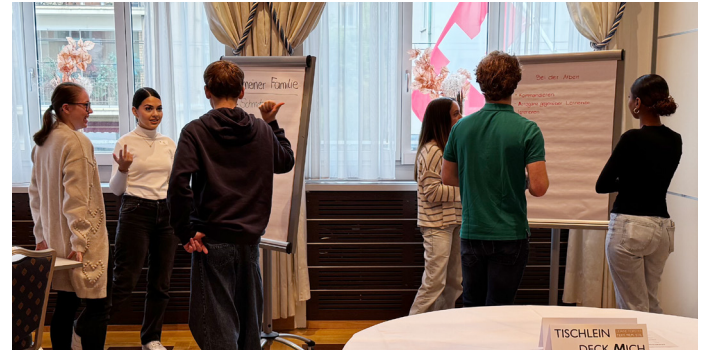
Die Lernenden sind mit viel Engagement und Freude dabei.

Nach der erfolgreichen Durchführung 2025 des Workshops «Gewusst wie durch den Benimm-Dschungel» für die Lernenden der GVZ-Mitgliedfirmen gibt's am 14. November 2026 eine zweite Chance für die Teilnahme. Darum sofort anmelden !