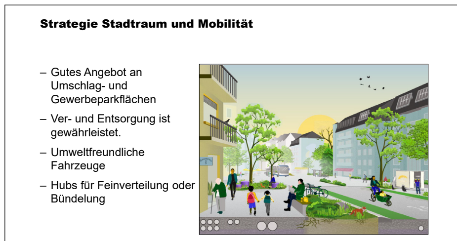
Aus der Präsentation der Veranstaltung

• Um die nachhaltige Mobilität zu unterstützen, will die Stadt künftig mit einem Förderprogramm die Teilfinanzierung von CarGoVelos übernehmen. Unternehmen können