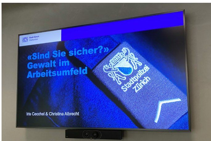
Sensibilisierung für den Umgang mit Drohungen und Aggressionen standen ebenso im Zentrum wie praktische Hinweise zur Vermeidung von Cyber-Attacken.

Am 28. Mai 2026 lud die Stadtpolizei Zürich in Kooperation mit dem GVZ zur Info-Veranstaltung «Sind Sie sicher?» für KMU ins Kommissariat Prävention an der Förrlibuckstrasse ein. Während anderthalb Stunden orientierten drei Mitarbeitende der Stapo, wie mit Beschimpfungen ,