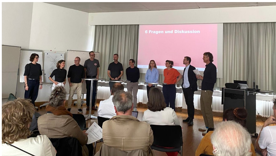
Die zahlreichen Referentinnen und Referenten der Stadtverwaltung stehen Rede und Antwort.