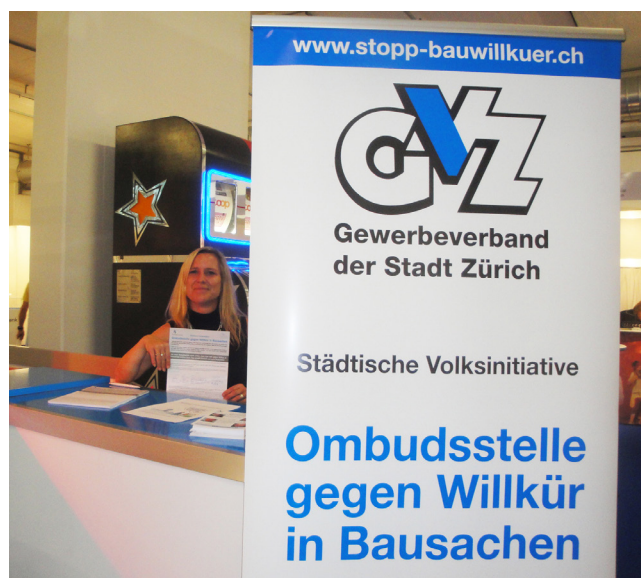
GVZ-Stand 2012: Rang 2 in der Beliebtheits-Skala der Züspa-Besucher.

Am Freitag, 27. September offeriert der GVZ einen Züspa-Apéro (ab 19.30 Uhr). Bestellen Sie Ihre Gratis-Tickets bis zum 24. September bei: u.woodtli@gewerbezuersch.ch