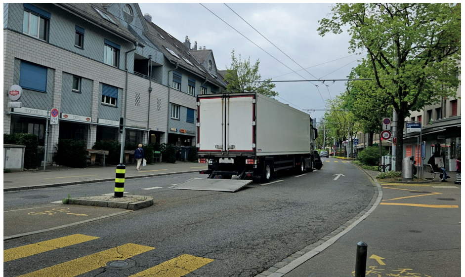
Mangels Umschlagplatz muss für die Anlieferung eine Spur zur Einfahrt ins Parkhaus kurz umgenutzt werden.

Am 7. April fand die zweite Veranstaltung mit Podiumsdiskussion im Rahmen der Strategie « Stadtraum und Mobilität 2040 » statt. Der GVZ war mit Geschäftsleitung und einigen Mitgliedern vertreten. Die geplante Massnahme für die Umsetzung urbane Logistik und Gewerbeverkehr ist «ein gutes Angebot an Umschlag- und Gewerbeparkflächen» . Markierte Umschlagplätze bzw. Parkierungsverbote seien nicht mehr notwendig, da der Güterumschlag in der Fussgängerzone grundsätzlich überall erlaubt sei, sofern der übrige Personen- und Verkehrsfluss nicht beeinträchtigt werde. In der Planung wird für die Realisierung davon ausgegangen, dass die neue Parkkartenverordnung (nPKV) von der Zürcher Bevölkerung angenommen wird. Auf die Frage, wie die Strategie bei einer Ablehnung der nPKV durch den Souverän umgesetzt werden soll, war Erstaunliches zu vernehmen: Die nPKV werde angenommen, es gebe keinen Plan B!