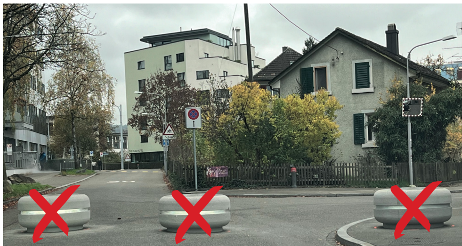
Die drei Boller sind wieder weg.

Auf Anfrage des Gewerbevereins Altstetten-Grünau wurde der GVZ bei