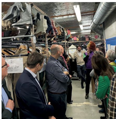
Besuch im Opernhaus Zürich mit anschliessendem Mittagessen im benachbarten «Ameron»