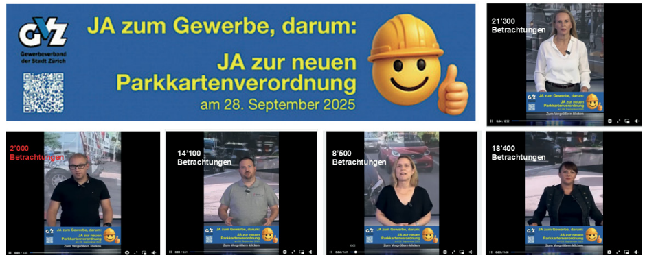
Mit Videobotschaften wurden bereits in den ersten zwei Wochen nach Lancierung beachtliche 64'300 Betrachtungen allein auf Facebook generiert.

Da die erweiterte Gewerbeparkkarte von grösster Bedeutung fürs Stadtzürcher Gewerbe ist, auch wegen des stetigen Parkplatzabbaus, schluckte der GVZ die bittere Pille und ging den Parkkarten-Kompromiss ein: Er sprach sich dezidiert für ein Ja zur