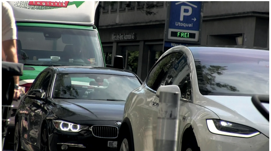
Alltag an der Dufourstrasse

Mitte August hatten die Reparaturarbeiten an Wasserleitungen und Abwasserkanälen in der Bellerivestrasse begonnen. Ende September kommunizierte die Stadt in ihrer Medienmitteilung , dass der Verkehr seit der vollständigen Umsetzung der temporären Verkehrsführung trotz Spurreduktion von vier auf zwei flüssig rolle – und redete die Situation damit schön. Selektiv betrachtet mag das, wenn auch nur zeitweise, stimmen. Überblickt man die Verkehrssituation unter Einbezug von Dufour- und Seefeldstrasse, fragt man sich schon, wie die Stadt zu dieser Aussage kommt. So wurden Zu- und Abfahrten zum Seefeld zwischen Seefeldstrasse und Kreuzstrasse komplett gesperrt und mehrere Fussgängerstreifen aufgehoben. Dafür kam es in der Dufour- und Seefeldstrasse immer wieder zu