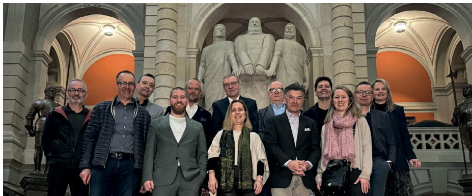
Besuch im Bundeshaus in Bern

Die Generalversammlung fand Mitte Mai bei Auto City Emil Frey Zürich Nord statt. Ein besonderes Highlight war die Podiumsdiskussion mit prominenten Teilnehmenden, die für einen regen Austausch sowie neue Impulse sorgten und den Abend zu einem echten Highlight machten. Ende September folgte die traditionelle Einladung durch den GVZ