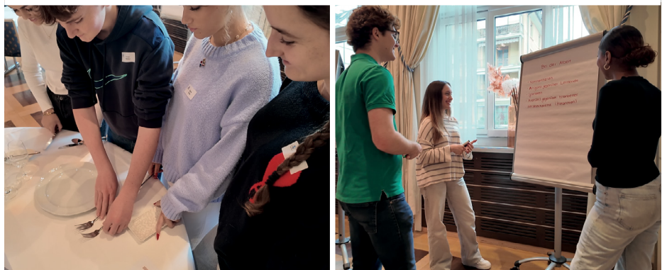
Etwas Theorie und sehr viel Praxis am Workshop